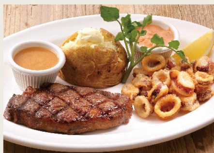
Rib Eye Steak 140g & Calamari