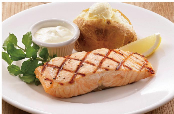
Grilled Salmon with Dill Sauce