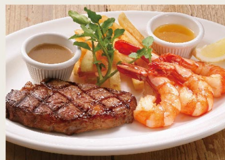
Rib Eye Steak 140g & Shrimp