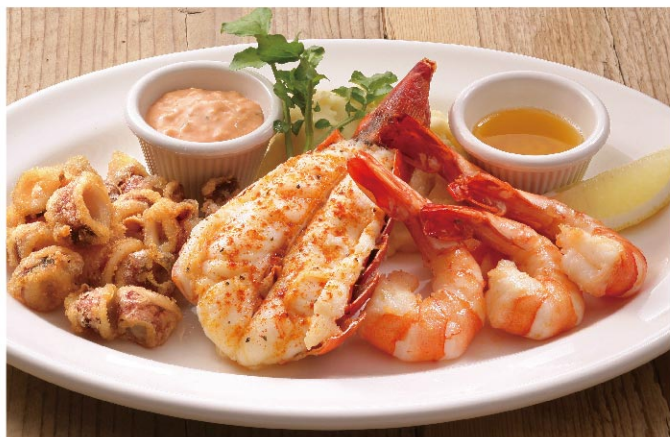
Seafood Platter (Lobster, Shrimp & Calamari)