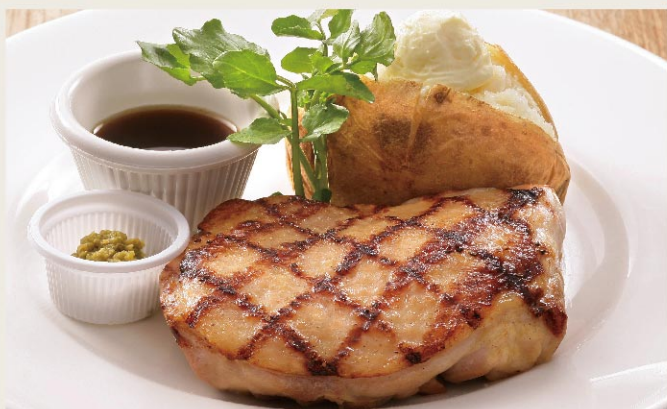
Grilled Chicken Thigh with Yuzu Pepper