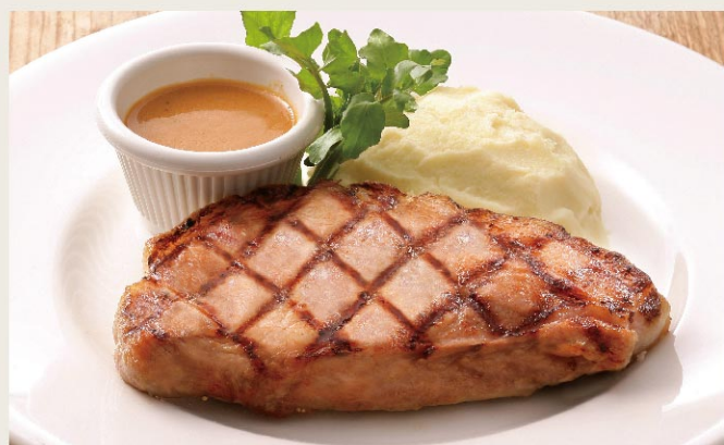
Grilled Yamato Pork Loin

【みつせ鶏】米めかや大麦・米などを中心とした穀物飼料で育てられたみつせ鶏。自然豊かな九州北部の山間を中心に約80日間長期肥育され、チルドでシズラーに届きます。