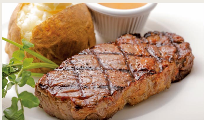
Rib Eye Steak 140g