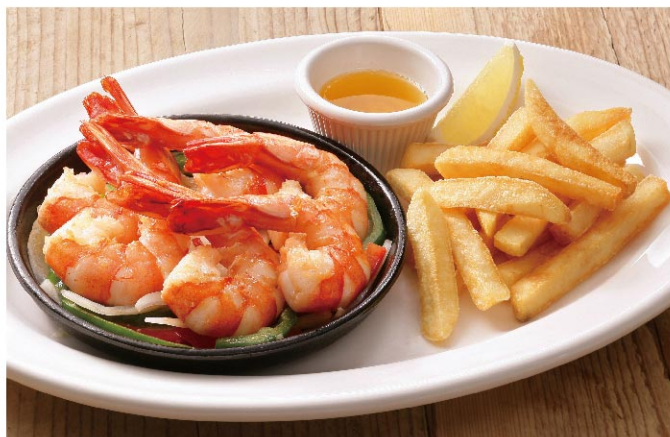
Sizzling Shrimp with Garlic Butter Sauce