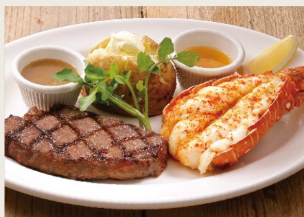
Rib Eye Steak 140g & Lobster