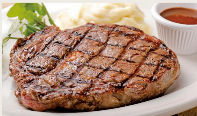
Rib Eye Steak 280g